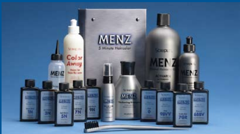
Unidad introductoria para peluquería del Tinte Capilar en 5 Minutos MENZ®