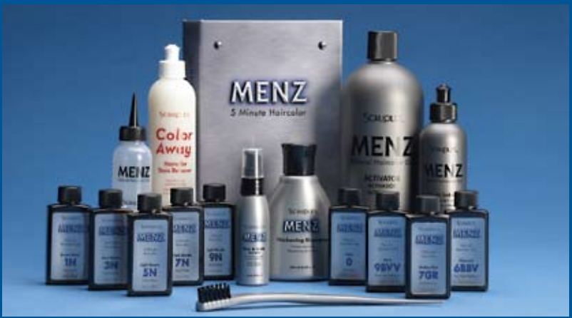
Unité d'introduction pour salon de la Coloration Cheveux en 5 Minutes MENZ®.